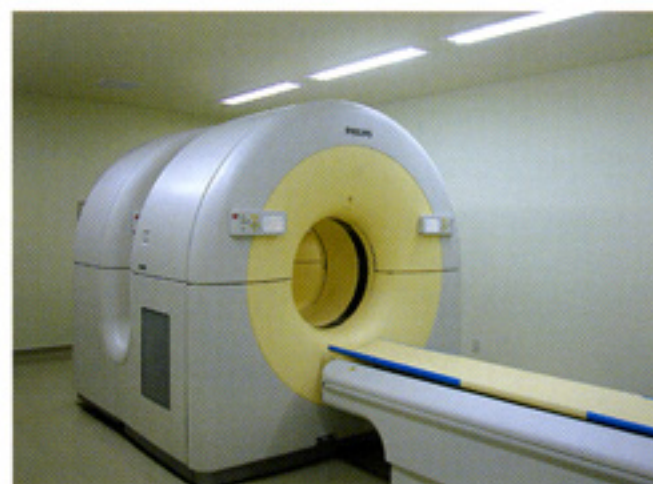
PET/CT装置(フィリップス社製)

9月末までに、1477件の検査が施行され、がんの診断ならびに治療に利用されています。地域病院および医院からの紹介率も20%を超えており、健康診断で受診された方は66名ですが、2例の方(3%)にがんが検出されました。がん診療にPET/CT検査がこれからもますます利用されるものと思います。