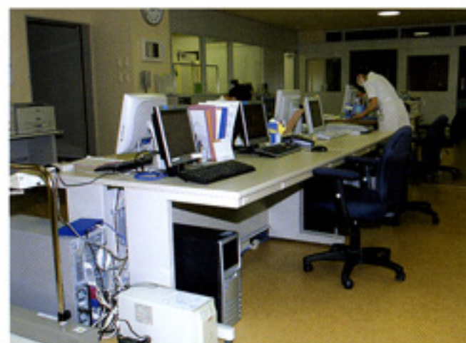
多人数用透析器をコンピューター集中管理し、電子カルテシステムとリンクさせて運用しています