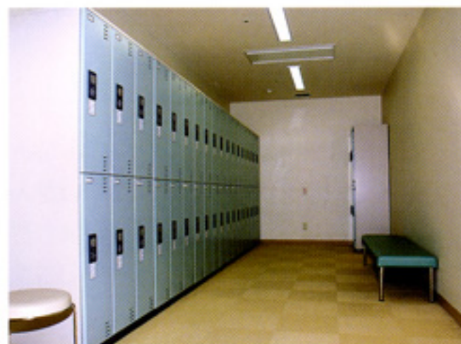
広くゆとりある更衣室で ロッカーはナンバーロック式となっており、鍵は必要ありません

当院での血液透析（旅行中の一時的な透析を含む）をご希望の方は電話（代表011-863-2101、内線2281または3009）またはEメール（tohd@keiyukaisapporo.or.jp）にてお問い合わせください。