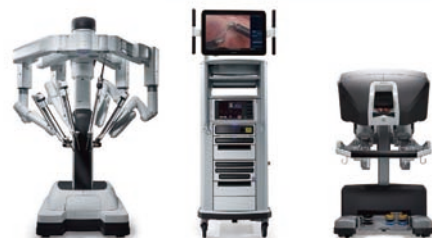
手術支援ロボット「ダヴィンチ Xi (da Vinci Xi)」